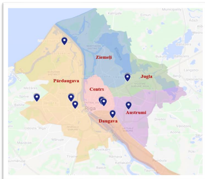
1.attēls. Iecirkņu ģeogrāfiskais izvietojums

Sabiedrība pakalpojumu nodrošināšanu organizē 6 teritoriālajos iecirkņos.