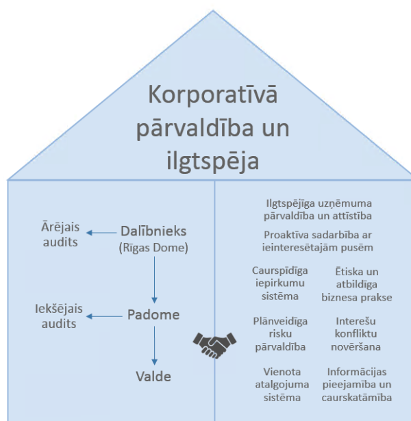
2. attēls. Sabiedrības korporatīvās pārvaldības un ilgtspējas modelis

Detalizēta kārtība, kādā Rīgas valstspilsētas pašvaldība (deleģējošā iestāde) īsteno dalībnieka pienākumus un nodrošina tās turējumā esošo kapitālsabiedrību, tajā skaitā, Sabiedrības, pārvaldību, noteikta Rīgas domes 2020. gada 21. augusta iekšējos noteikumos Nr. 4 "Rīgas valstspilsētas pašvaldībai piederošo kapitāla daļu un kapitālsabiedrību pārvaldības kārtība" (prot. Nr. 24, 50. §) (ar grozījumiem, kas izdarīti ar Rīgas domes 2022. gada 21. septembra iekšējiem noteikumiem Nr. RD-22-16-nt).