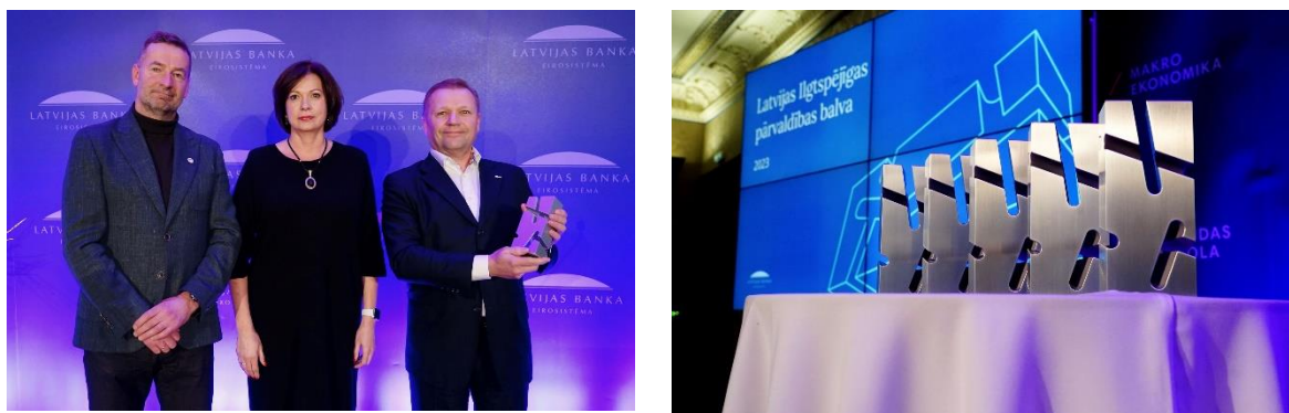
12.attēls. Ilgtspējīgas pārvaldības balvas 2023 pasniegšana

Sabiedrībā regulāri tiek saņemtas arī klientu pateicības gan par operatīvi un kvalitatīvi paveiktu darbu, gan par pozitīvu un laipnu komunikāciju.