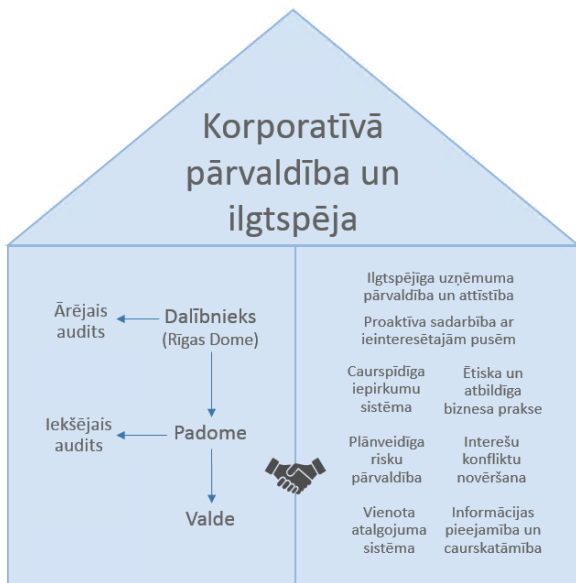
1. attēls. Sabiedrības korporatīvās pārvaldības un ilgtspējas modelis

Korporatīvās pārvaldības modelī iesaistīto pušu kompetenci, pienākumus un atbildību nosaka atbilstoši Komerclikuma, Publiskas personas kapitāla daļu un kapitālsabiedrību pārvaldības likuma un citu kapitālsabiedrības darbību regulējošo aktu prasībām, kā arī Sabiedrības statūtiem.